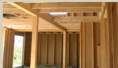
Construction ossature bois