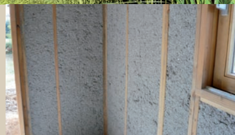
Ouate de cellulose

Avec sa façade alliant bardage bois traité et de grande qualité et brique blanche, la résidence le Cabrifuelh révèle tout son caractère contemporain. Ses lignes épurées, son isolation optimale grâce à la ouate de cellulose ainsi que son architecture dynamique jouant sur les matériaux et les volumes, lui confèrent une dimension chaleureuse, tout en participant à son intégration dans le paysage urbain.