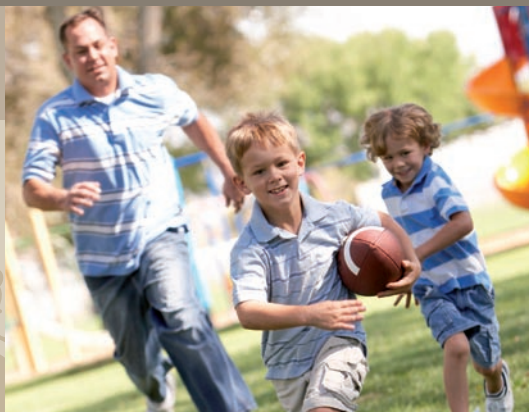
Parc de jeux de Cornebarrieu

À 500 mètres du centre historique de Cornebarrieu, ce nouveau quartier de 54 ha privilégie votre confort tout en réservant une place essentielle aux espaces verts. Proximité immédiate des équipements publics (crèche, école, médiathèque) et services (grand centre commercial à 5 minutes en voiture, commerces à deux pas de la résidence) : Le Cabrifuelh réussit l'alchimie parfaite entre un cadre préservé et les nécessités de la vie contemporaine.