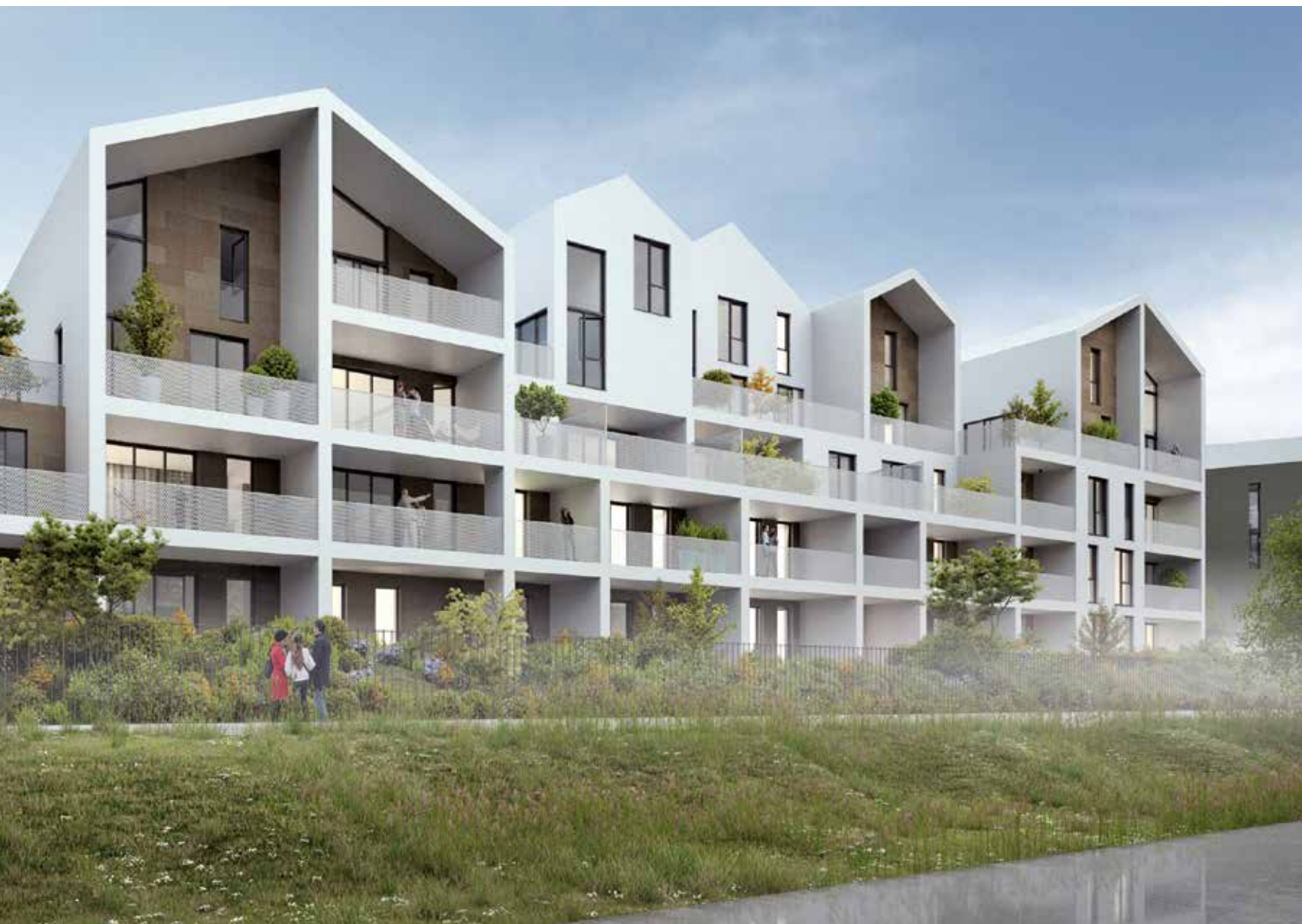
Vue de la façade Sud