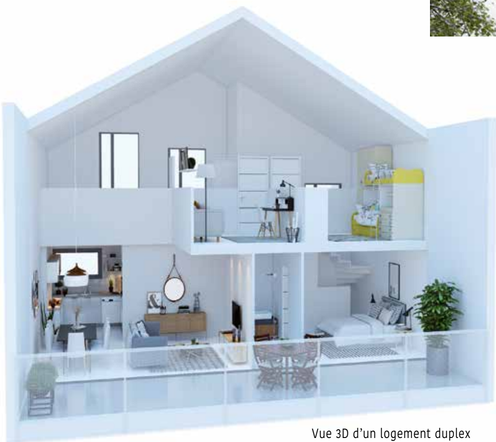
Vue 3D d'un logement duplex