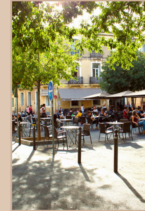
Place des Beaux-Arts

Avec ses multiples placettes ombragées et lieux de convivialité, le quartier des Beaux-Arts invite à une vie méditerranéenne, douce et inspirée. Desservi par le tramway et facile d'accès, il est doté de tous les commerces de proximité et services nécessaires. Les habitants aiment son animation et la vie de son marché traditionnel. Bordé par les toutes proches respirations verdoyantes que sont le parc Edith-Piaf, le Domaine de Méric et le complexe sportif Pierre-Rouge, il se situe à quelques pas du centre historique et de la Comédie aux deux opéras, théâtres, cinémas et aux bonnes tables bistro-bonomiques.