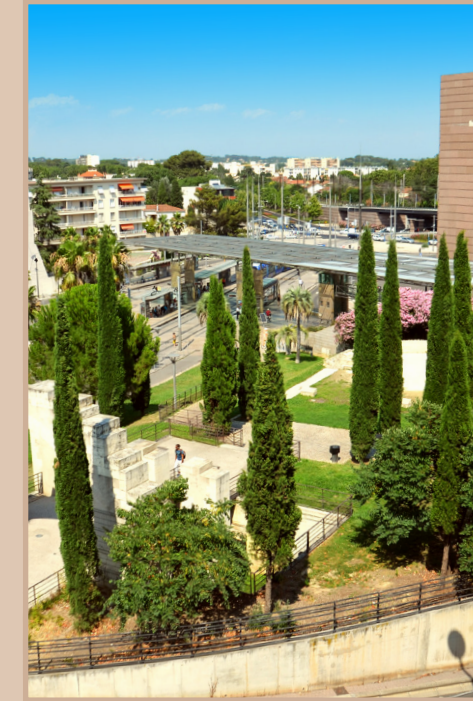
Vue sur le Corum et le quartier des Beaux-Arts

LE QUARTIER "VILLAGE" OÙ BIEN VIVRE EST UN ART